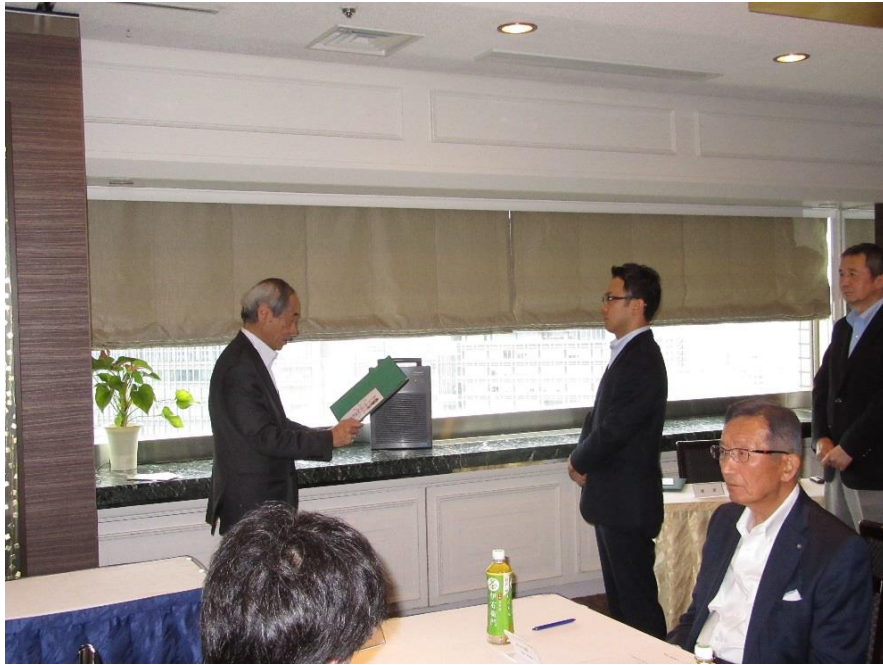
(定時総会：平山前会長（代理：平山常任理事）の表彰)