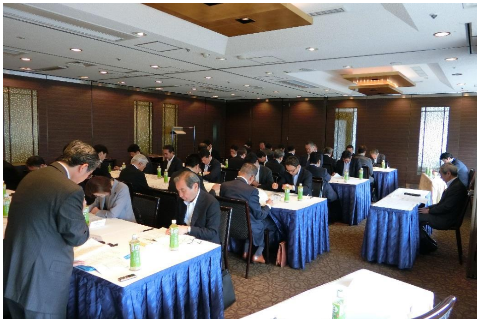
（定時総会：審議状況）