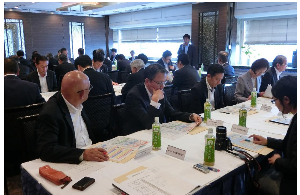
(軽減税率制度説明会：東京国税局よりの説明)